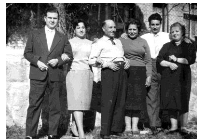
Fotografia de família.