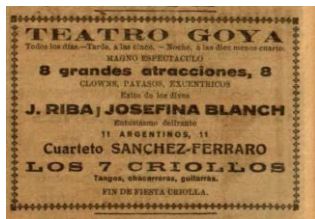
Al teatre Goya, gener 1930

El dimarts 28 de gener de 1930, Riba va actuar al teatre Goya de Barcelona en un espectacle que tenia com a gran atracció un número de Balls Russos. En l'espectacle també va cantar la seva gran mestra Gali Markov, qui segurament, va tenir molt a veure amb aquella primera actuació. Era el mateix dia que el General