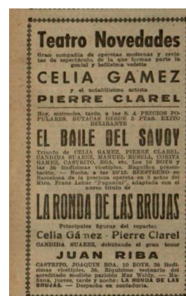
Al teatre Novedades, febrer 1935.