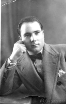
Fotografia d'estudi de Joan Riba

Joan Riba Vallés (Almatret 1904 - Badalona 1992), tenor d' Almatret. Entre els anys 1930 i 1936 va ser una gran figura de l'espectacle. Va actuar al costat de les figures més prestigioses i en els teatres més importants de l'estat, sobretot de Barcelona i València, interpretant les sarsueles i operetes de més èxit del moment al costat dels millors i de les