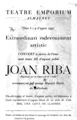
Actuació a Almatret, agost 1931.