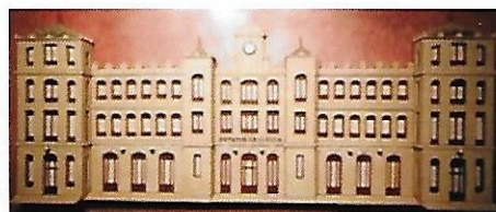
Estació de trens de Lleida