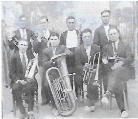
ORQUESTRA LA VIOLETA Sant Miquel, 1927