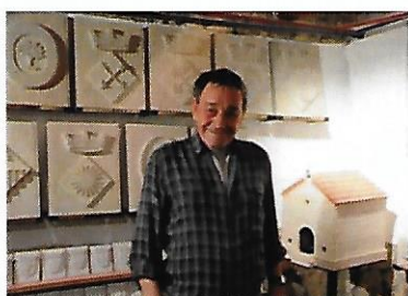
Taller i eines

A poc a poc la seva salut es va anar ressentint i l'artrosi a les mans i a les cames li van impedir continuar mantenint el ritme de producció escultòric i treball al camp. L'últim tram de la seva vida va tenir una altra companya: una "motoreta" per moure's pel poble. També s'hi van afegir problemes de cor, la seva última malaltia. Va acceptar i adaptar amb molta dignitat aquesta situació.