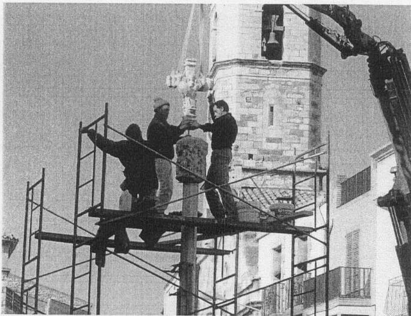
Col·locació de la Creu de Terme – Desembre 2005

Des de llavors els diferents punts de vista no s'han fet esperar, i les reaccions han estat tan diverses com fins ara havien estat les possibilitats per fer front al terrorisme a Espanya; no obstant, hi ha hagut un punt de cohesió que ha unit totes les veus, que és el sentiment d'esperança, per un cop hi ha un nexa comú i un punt de partida unitari entre grups polítics i entre pobles. Ara ens cal esperar que les negociacions pel procés de normalització política a Euskadi no s'eternitzin, i que els interlocutors electes procurin les circumstàncies necessàries perquè el procés de pau sigui realment de pau.