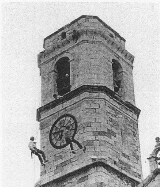
Exhibició de bombers i voluntaris.